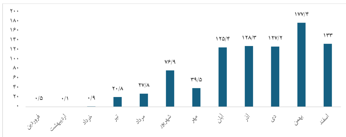
نمودار ۲- آمار برات صادره به تفکیک ماه در سال ۱۴۰۴ (هزار میلیارد ریال)

برات الکترونیکی زنجیره تولید به‌عنوان یک ابزار تعهدی از ابتدای سال ۱۴۰۴ با قابلیت انتقال در زنجیره تولید و تنزیل در شبکه بانکی، و به‌منظور تأمین مالی سرمایه در گردش اشخاص حقیقی و حقوقی عملیاتی شده است. در حال حاضر ۱۰ بانک شامل بانک‌های صادرات ایران، سپه، صنعت و معدن، تجارت، ملی ایران، ملت، رفاه کارگران، سینا، شهر و پارسیان با دسترسی به زیرساخت مربوطه قادر به صدور برات الکترونیکی زنجیره تولید می‌باشند. مجموع عملکرد این ابزار در سال ۱۴۰۴ مبلغ ۸۵۷.۷ هزار میلیارد ریال می‌باشد که به ترتیب بیشترین عملکرد مربوط به بانک‌های تجارت، ملت و صادرات می‌باشد. روند ماهانه صدور برات الکترونیکی نشان دهنده عملکرد صعودی آن می‌باشد که متأثر از توسعه تامین زیرساخت فنی آن توسط بانک‌ها می‌باشد. افت عملکرد در اسفندماه عمدتاً ناشی از شرایط جنگ تحمیلی بوده است.