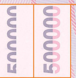
- طرح ناقص دو طرف چک رویت طرح به صورت کامل در مقابل تابش نور امکان پذیر است.

می باشد، در صورتی که در نمونه های جعلی خطوط طرح از ترکیب نقطه های رنگی تشکیل شده که با ذره بین قابل رویت می باشد.