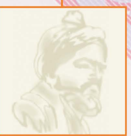
- واترمارک نقش تصویر فردوسی در خمیره کاغذ.