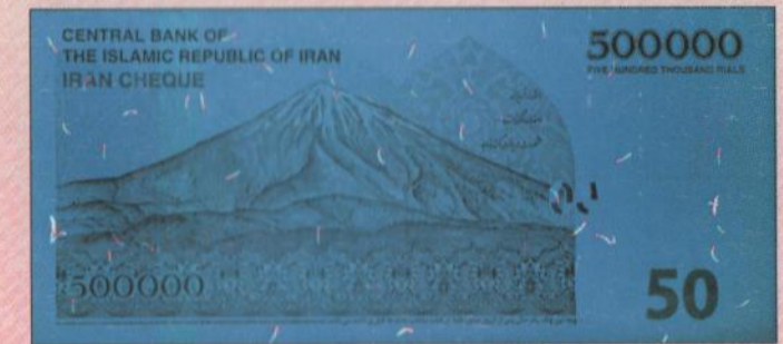
اندازه : ۱۵۶ X ۷۱ میلی متر