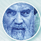
چاپ برجسته Intaglio print