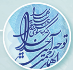
پوشش ورنی موضعی Spot varnish cover