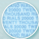
ریز چاپ Microprint