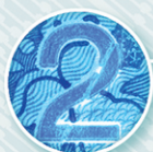
تصویر مکمل (سیترو) Offset See-through register