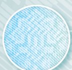
طرح زمینه خطی Linear design