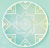
طراحی خطی Linear design