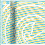
نخ امنیتی پنهان با ریزنوشته Embedded security thread with microtext