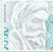
واتر مارک Watermark