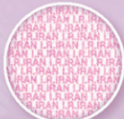
ریز چاپ Microprint