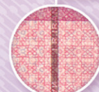
نخ امنیتی پنهان با ریز نوشته IRIRAN Embedded security thread with microtext