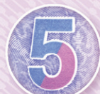
تصویر مکمل (سیترو) Offset See-through register