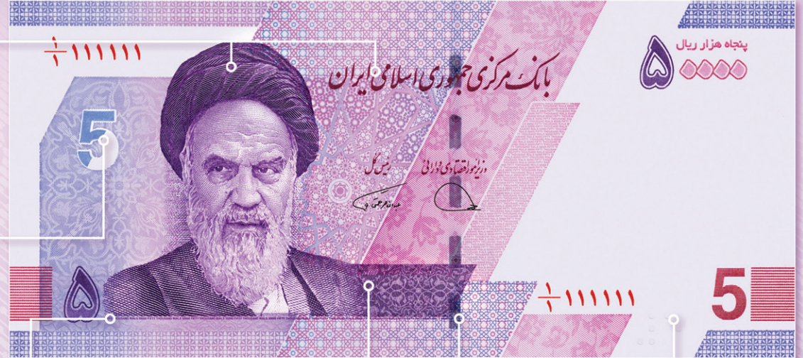
علامت مخصوص روشندان Sign for the blind