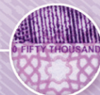
ریز چاپ برجسته Intaglio microprint