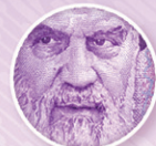
چاپ برجسته Intaglio print