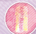
نخ امنیتی پنجره‌ای هولو گرافیک با ریز نوشته IRIRAN و نشان بانک مرکزی Windowed security holographic thread with microtext